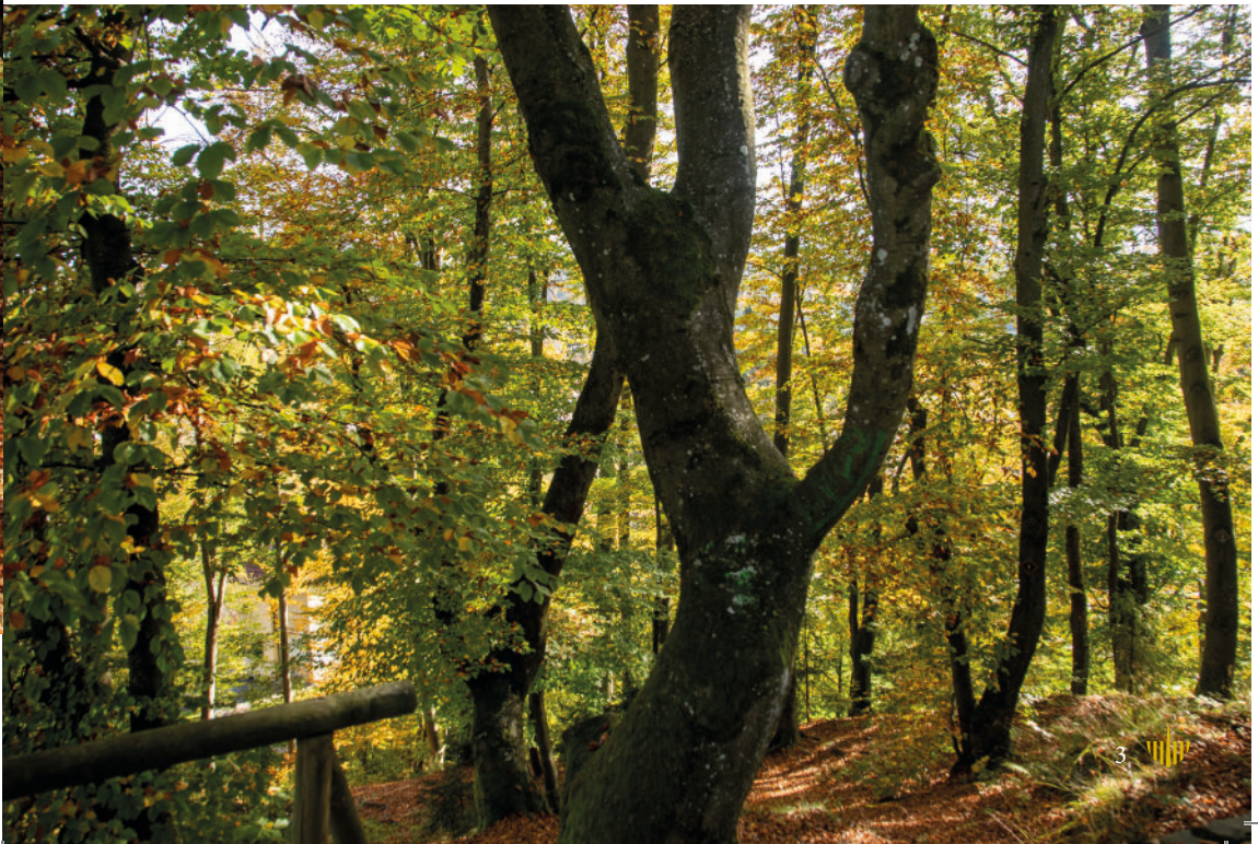
Friedensforst Velden am Wörthersee

Die Gestaltung der Beisetzung in einem Friedensforst bleibt weitgehend den Wünschen der/des Verstorbenen bzw. der Angehörigen überlassen. Christliche Bestattungen sind ebenso üblich wie Bestattungen ohne geistlichen Beistand. Eine Beisetzung in einem Friedensforst bietet so eine würdevolle Alternative zu den bislang gewohnten Bestattungsritualen.