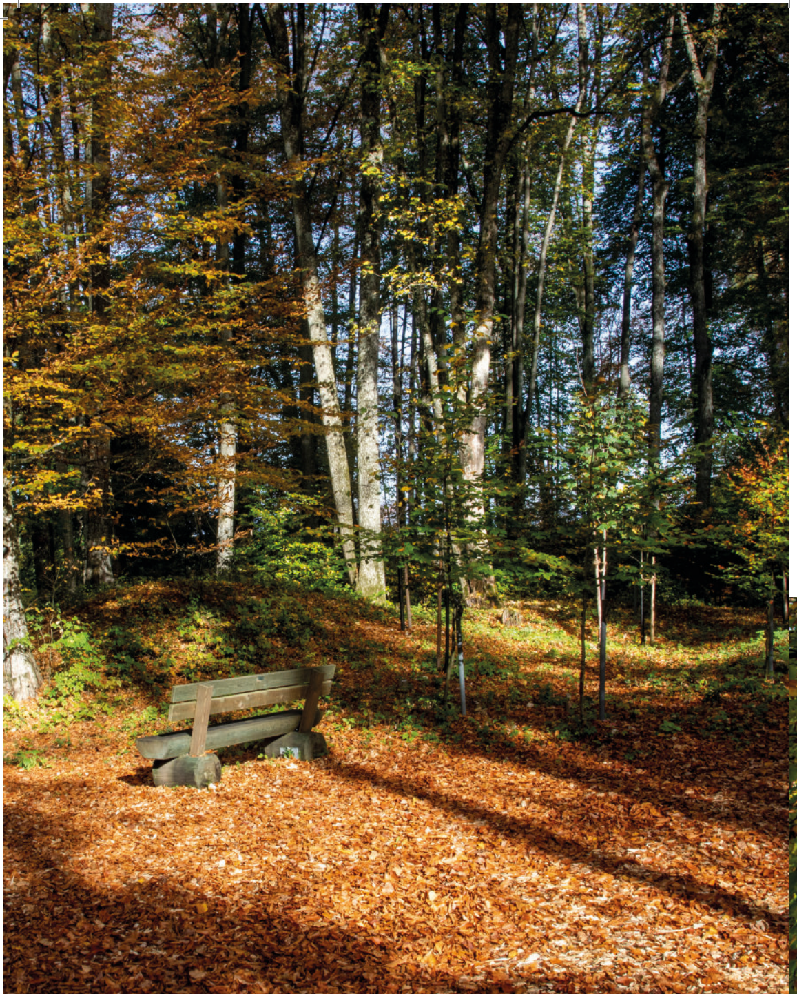
Friedensforst Klagenfurt am Wörthersee