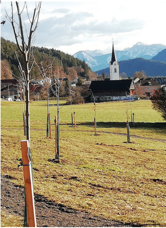
Friedensforst Gottestal (Wernberg)